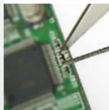
Measuring Small Electronic Components

Messung von kleinen elektronischen Bauteilen