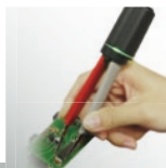
PCB Circuit Conductivity Test