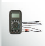
Multimeter Connecting Cable