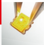
LED Light-up Test